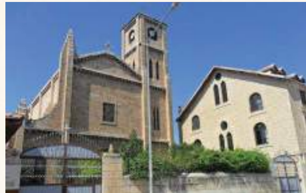
Mersin'in halen ayakta olan kiliseleri: Latin Katolik Kilisesi