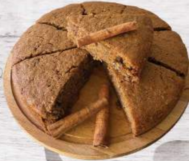
HAVUÇLU KEK 45 tl