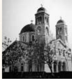
Aya Yorgi Kilisesi

O eser Rum Ortodoks Kilisesi yani Aya Yorgi'ydi.