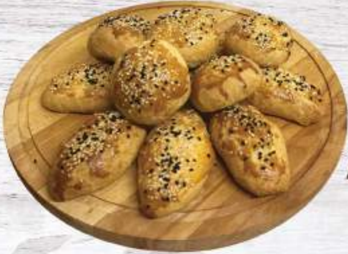
POĞAÇA 1kg 30 tl