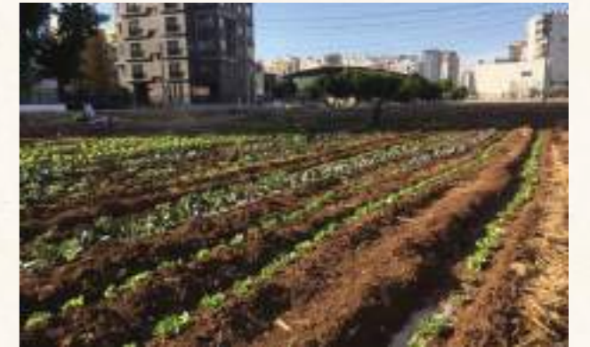
Resimdeki iki çocuk bisikletleriyle gezmeye her çıktıklarında gelip neyle uğraştığımızı sorar ve biraz da yardım eder.

Bu grup içinde bir küçük grup var ki, önceleri biraz bozuluyordum onlara ama artık umutlanıyorum. Bu kişilerde büyük bir toprak özlemi var, toprağa dokunmak istiyorlar. "Şu köşede bana mendil kadar bir yer ver, orada ekip biçeyim" diyorlar. Bozuluyordum çünkü kolektif bir üretime katılmak değil istedikleri, hobi bahçesi gibi, sadece kendileri için istiyorlar bunu. Ama artık umutlanıyorum, çünkü toprakta bir şeyler üretmeye özlem duyanlar bu kadar çoksa, onları evlerinin yakınındaki boş arsalara kent tarımı için kullanmaya ikna etmek de mümkün olabilir. Herkes her yerde ekip biçse, şehirler kocaman bir bahçe olur. Bebekler, tıpkı nineleri, dedeleri gibi, toprakla oynaya oynaya büyür.