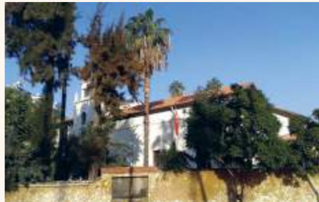
Rum Ortodoks Kilisesi